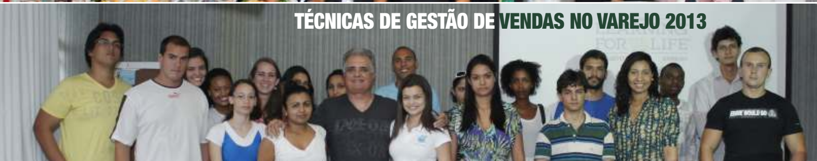
TÉCNICAS DE GESTÃO DE VENDAS NO VAREJO 2013