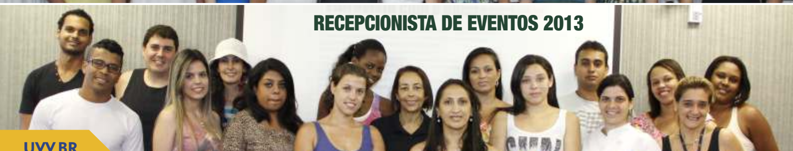
RECEPCIONISTA DE EVENTOS 2013